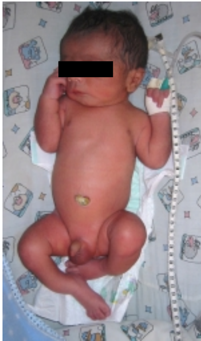
Figura 1. Se destaca el acortamiento rizomélico en las cuatro extremidades y el marcado encorvamiento de las tibias.