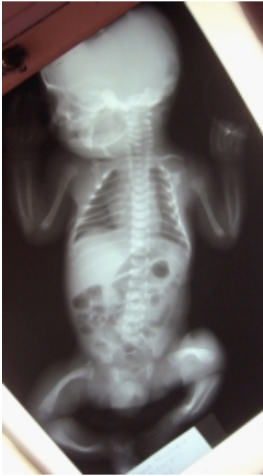
Figura 3. Se evidencian 11 pares de costillas, tórax en forma de campana y encorvamiento de huesos largos.