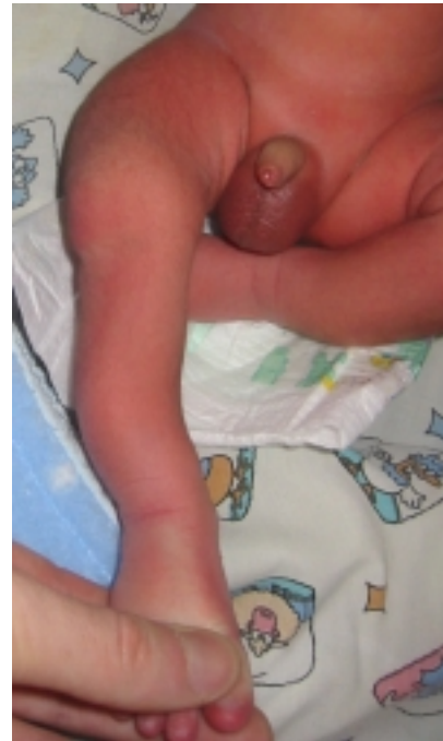
Figura 2. Detalle del miembro inferior derecho con encorvamiento anterior de la tibia.

primer y segundo trimestres. Antecedentes maternos farmacológicos: beclometasona tópica por rinitis alérgica. Paraclínicos: ecografías prenatales en número de 5. En la tercera (con una edad gestacional de 20 semanas) mostró encorvamiento bilateral del fémur.