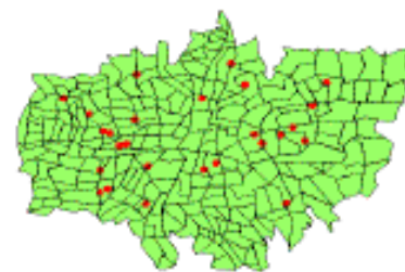
Figura 2. Muertes por accidentes de tránsito según barrio. Medellín 1992-1996

Sexo y asociación con formas de morir. Se estimó la relación entre el sexo y las causas de muerte ajustado