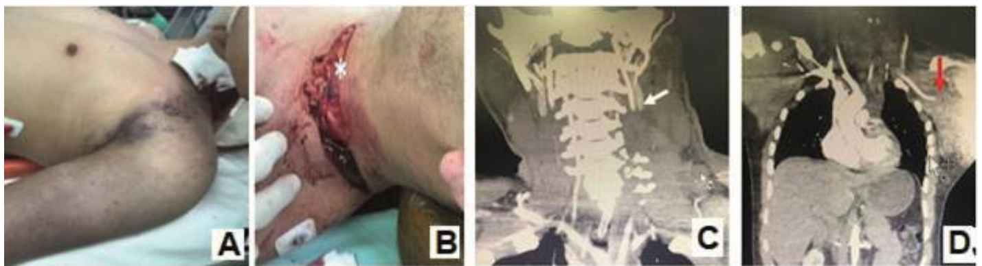
Figura 1. Disociación escápulo-torácica y el trauma cerrado de la arteria vertebral concomitante A. Inspección del paciente al ingreso en reanimación B. identificación de lesión cervical en zona I izquierda. B. Angio TAC de cuello, flecha de color blanco, trombosis del segmento V2 de arteria vertebral izquierda. C. Angio tac de cuello, abdomen y tórax, flecha de color rojo, sección completa de arteria axilar izquierda, aumento de la densidad de tejidos blandos en región axilar.

En el postoperatorio, el paciente fue trasladado a la unidad de cuidados intensivos. La angiografía por resonancia magnética de columna cervical y médula espinal y la tomografía computarizada de la cabeza mostraron una lesión en los segmentos V1 y V2 de la arteria vertebral izquierda sin signos de disección, un hematoma espinal y edema cerebral sin lesiones isquémicas. Una junta médica de neurocirugía y neurorradiología intervencionista decidió un tratamiento conservador para limitar la trombosis distal de la arteria vertebral mediante