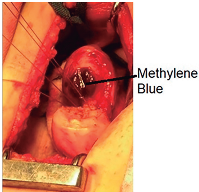
Figura 2. Cavity uterine stained with methylene blue.