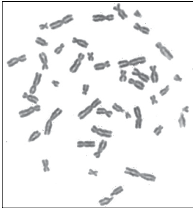
Foto 1. Metafase de linfocito de sangre periférica. Aumento 1000X

las concentraciones 2.5 (alta), 1.25 (media) y 0.02 mg/ml (baja) del fungicida por 48 horas. Estas concentraciones correspondieron a las finales en el medio de cultivo. Preliminarmente se aplicó la técnica de índice mitótico para seleccionar las concentraciones alta, media y baja que disminuyeron las células en mitosis en 75%, 50% y 25%, respectivamente en relación con el control. Para el análisis de aberraciones cromosómicas, se utilizó la técnica de doble ciego para eliminar la tendencia subjetiva de correlacionar los resultados entre las concentraciones y los controles. Se realizaron los respectivos extendidos celulares y se observaron por cultivo entre 100-200 células en metafase con un rango entre 44 y 47 cromosomas. Se registraron en cuadros únicamente las ACE observadas a partir de coloración regular homogénea (Giemsa). No se efectuaron evaluaciones posteriores a las 48 horas de tratamiento, para evaluar in vitro los daños genéticos no reparados por los mecanismos de control celular y reparación de ADN, inducidos por el fungicida. Se tomaron microfotografías de algunas metafases observadas con y sin aberraciones cromosómicas.