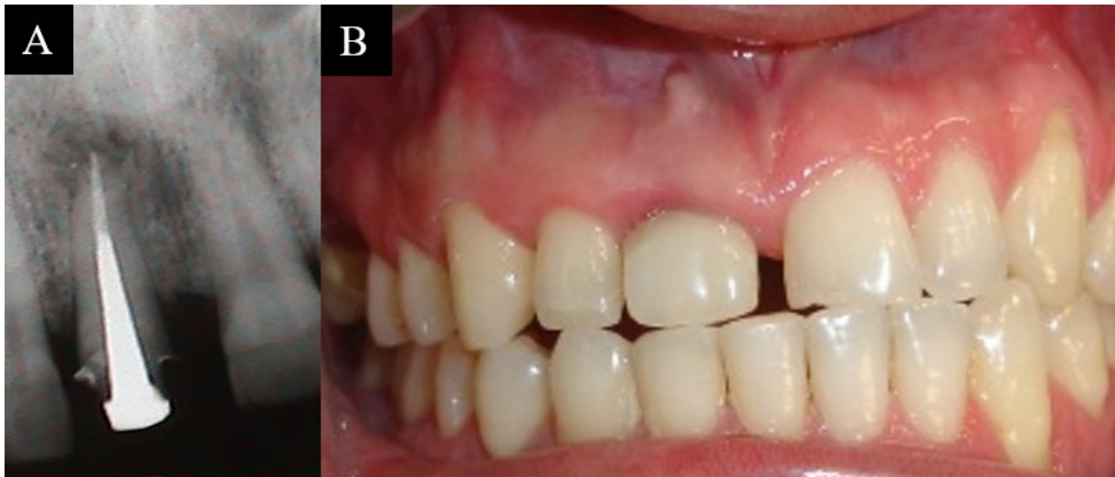
Figura 1. A. Retenedor intrarradicular y lesión apical. B. Asimetría del zenith gingival en el 11.

Después de esto, se continuó con la fase de rehabilitación donde se procedió a tomar la impresión definitiva, se realizó el montaje de modelos de estudio y se envió al laboratorio para la confección de la cofia metálica, la cual se probó, se determinó el color y se cementó la corona completa de forma definitiva. Clínicamente no se encontraron cambios de la movilidad dental al final del tratamiento (Figura 2B).