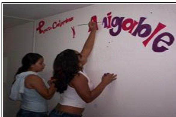
Figura 1. Jóvenes de la zona de ladera pintando un mural del consultorio para los SAJ