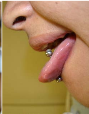
Fotografía 2. Piercing en la lengua es uno de los sitios de mayor predilección