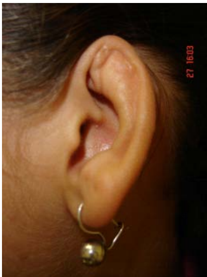
Fotografía 6. Cicatrización queloide en el canal del hélix de la oreja