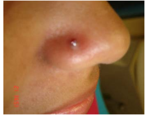
Fotografía 3. Inflamación en bordes laterales