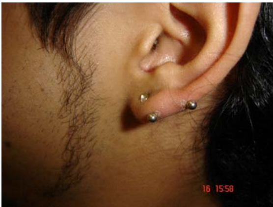
Fotografía 4. Edema del lóbulo de la oreja