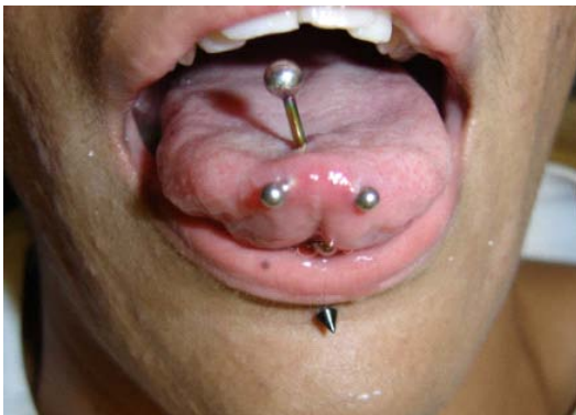
Fotografía 1. Joyas ubicadas en lengua y labio