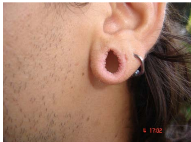
Fotografía 5. Lesiones permanentes en el lóbulo de la oreja como consecuencia del uso prolongado de expansores